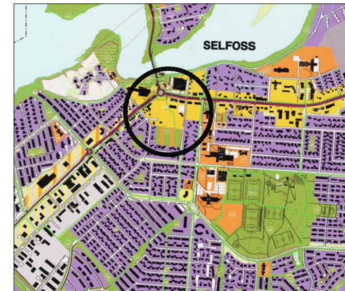
Hluti af Þéttbýlisuppdrætti Árborgar 2010-2030